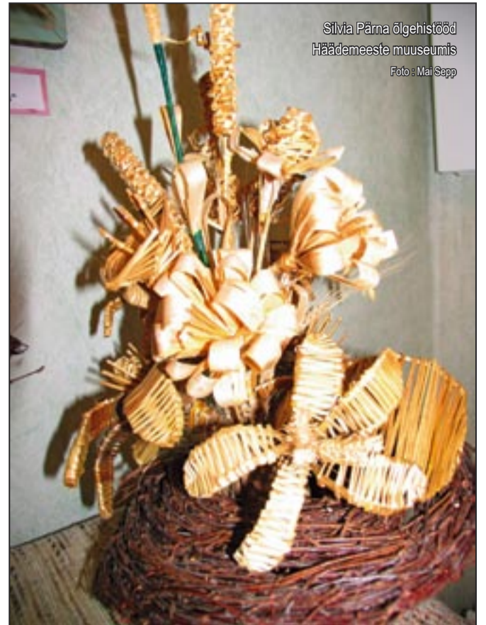
Silvia Pärna õlgehistööd Häädemeeste muuseumis