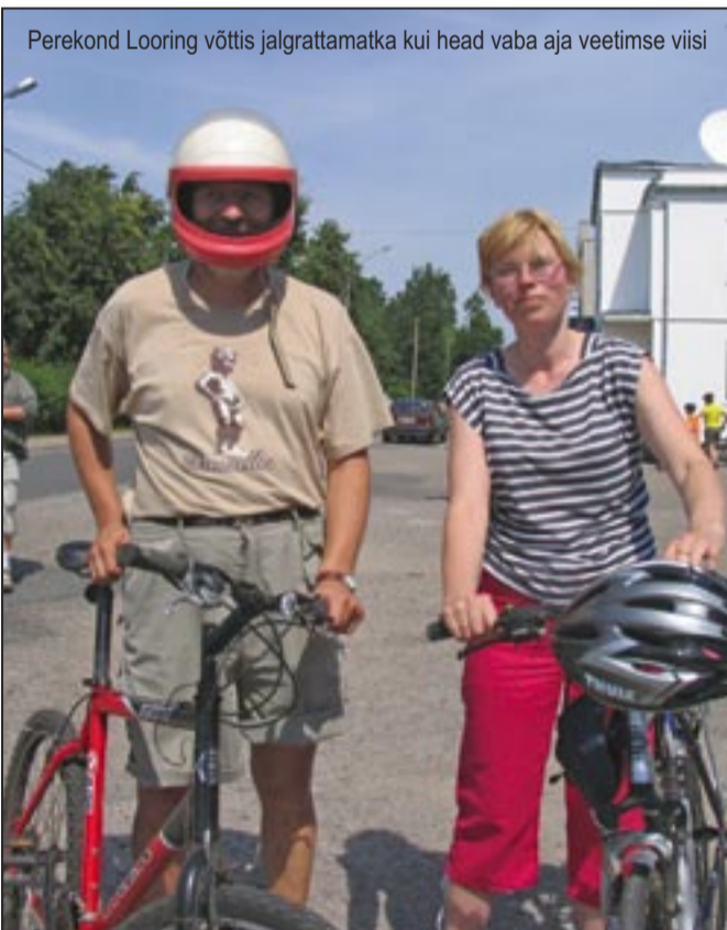
Perekond Looring võttis jalgrattamatka kui head vaba aja veetmise viisi