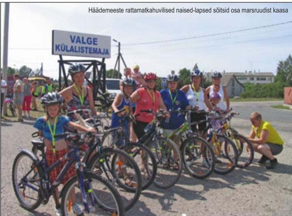
Häädemeeste rattamatkahuvilised naised-lapsed sõitsid osa marsruudist kaasa