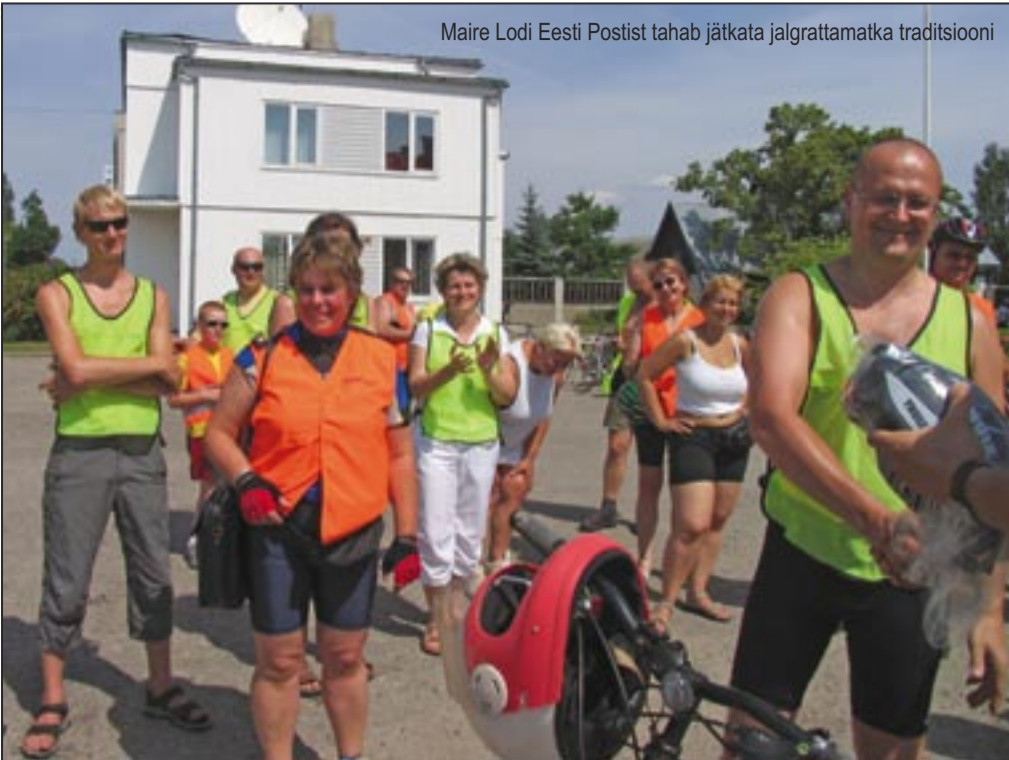
Maire Lodi Eesti Postist tahab jätkata jalgrattamatka traditsiooni