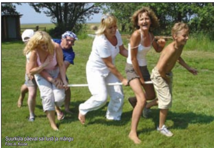
Suurküla päeval sai lusti ja mängu