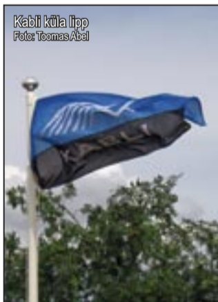
Kabli küla lipp