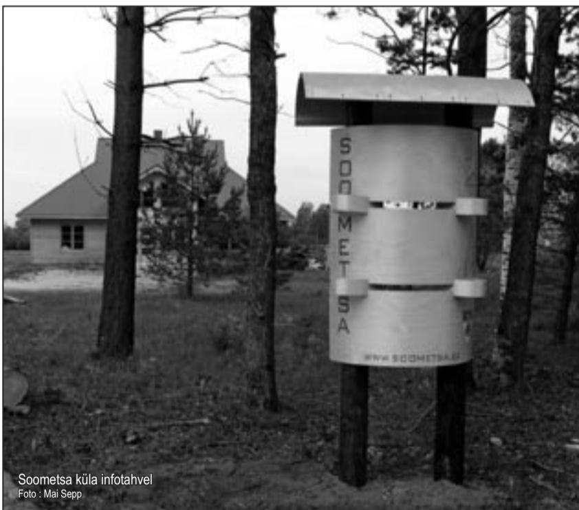
Soometsa küla infotahvel